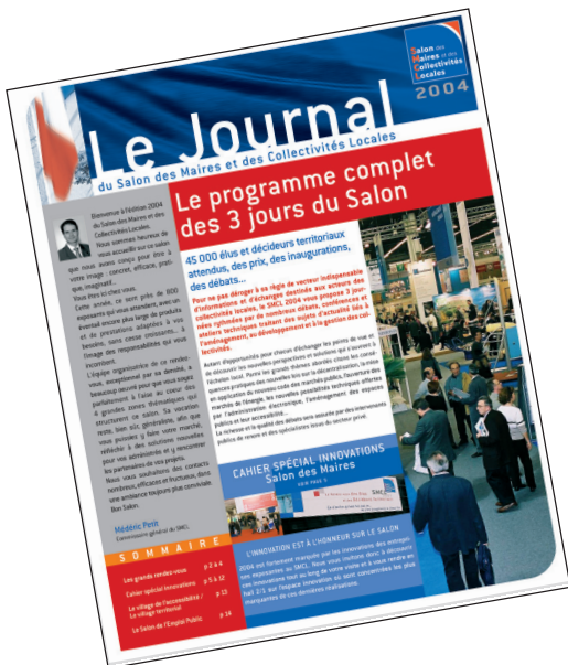
Format du journal L232x h287 mm

Attention : le nombre d'annonceurs étant limité, les bons de commande seront validés par ordre d'arrivée.